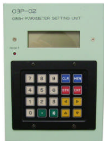
OBP-02 OBS パラメータ設定器